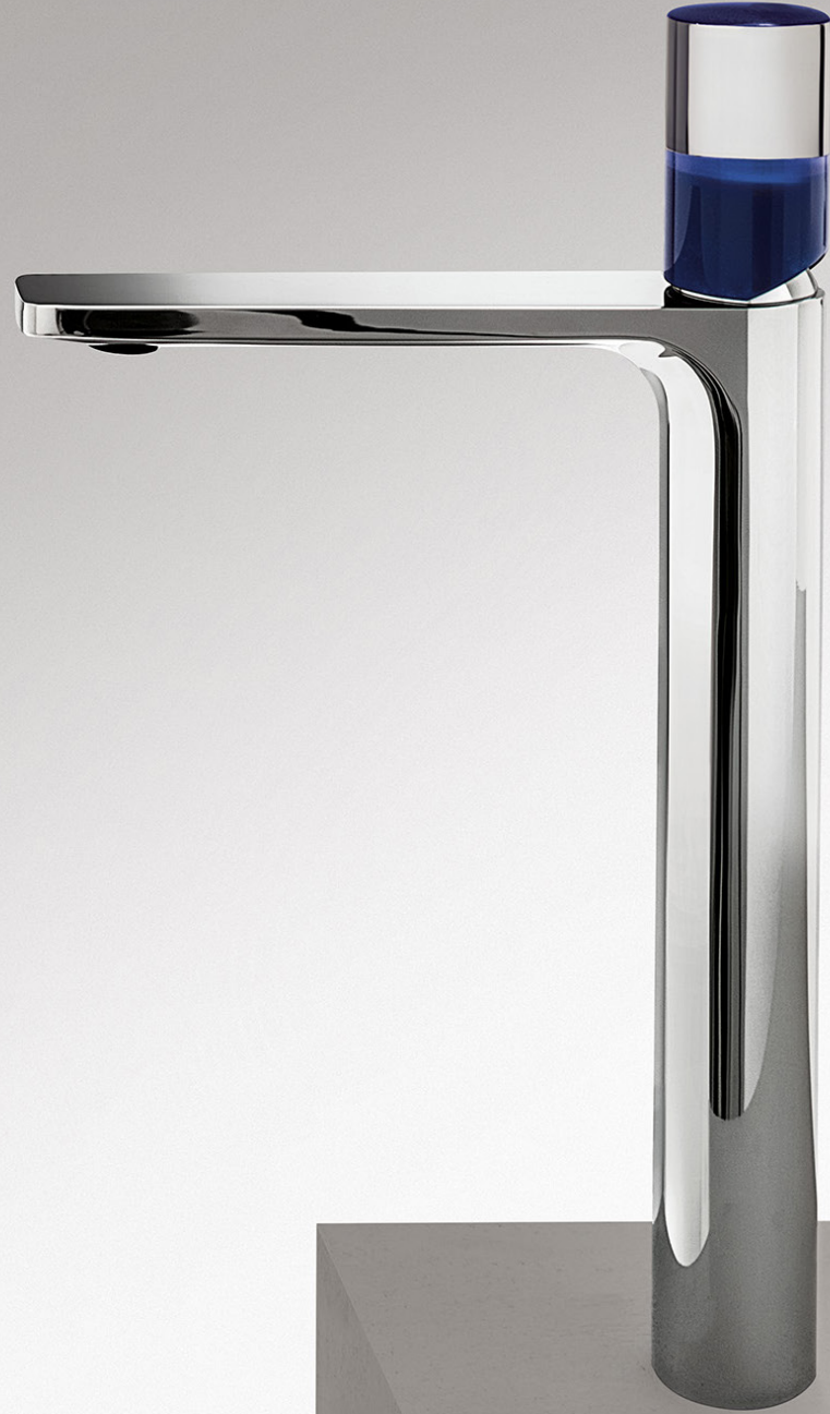
02 S006SWF - F4 S048 (1 PZ) Miscelatore lavabo alto monoforo, cromo - Maniglia. Single-hole high washbasin mixer, chrome - Handle. Mitigeur lavabo surélevé monotrou, chromé - Manette 1-Loch-Waschtischmischer hoch, Chrom - Griff. Monomando lavabo alto, cromo - Maneta.