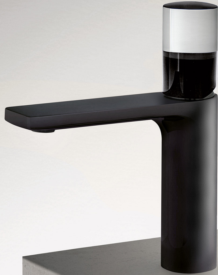
13 S004SF - F3 S048 (1 PZ) Miscelatore lavabo monoforo, nero opaco - Maniglia. Single-hole washbasin mixer, matt black - Handle. Mitigeur lavabo monotrou, noir mat - Manette 1-Loch-Waschtischmischer, Schwarz matt - Griff. Monomando lavabo, negro opaco - Maneta.